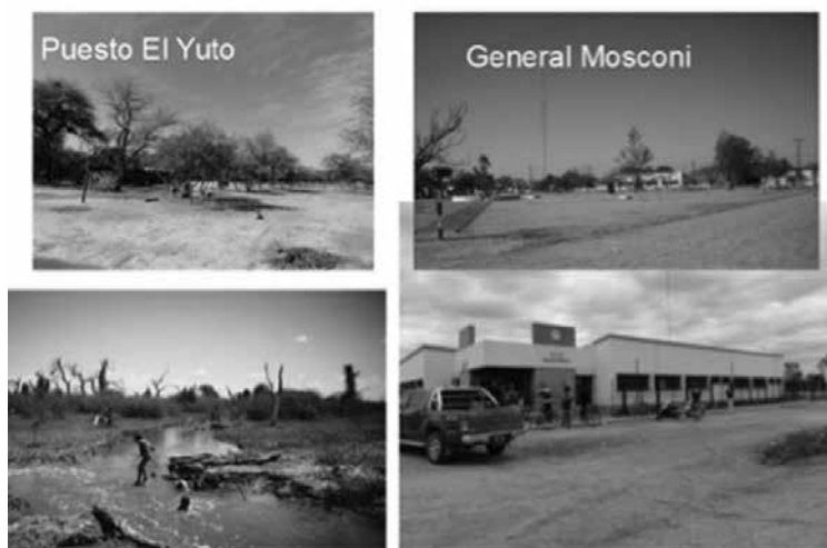
Figura 3 – Imágenes de Ramón Lista

El predominio de actividades de subsistencia, el escaso empleo formal y los magros ingresos hacen que la enorme mayoría de la población (76,52%) carezca de cobertura de salud por obra social. Los datos del 2010 lo ubican casi último (523/525).